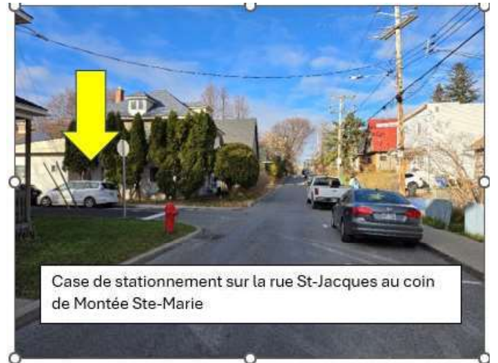
Case de stationnement sur la rue St-Jacques au coin de Montée Ste-Marie