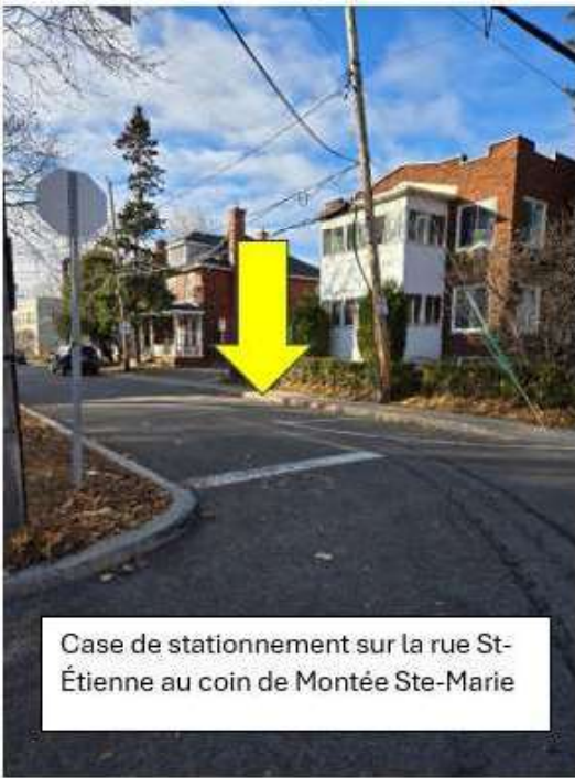
Case de stationnement sur la rue St-Étienne au coin de Montée Ste-Marie