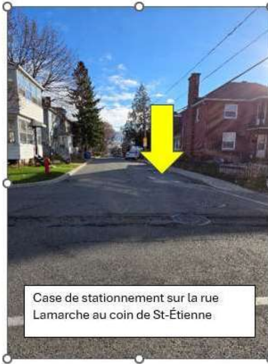
Case de stationnement sur la rue Lamarche au coin de St-Étienne