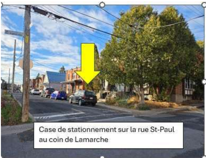
Case de stationnement sur la rue St-Paul au coin de Lamarche